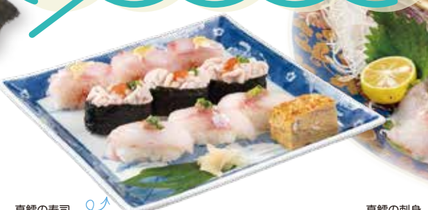
真鱈の寿司 真鱈の刺身

鍋物やフライ等の加熱調理が一般的な真鱈ですが、宮古ではお刺身でも楽しめます。宮古の真鱈は、日帰りの「沖合底びき網漁業」や魚体を傷つけない「はえなわ漁業」により漁獲