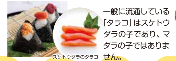
スケトウダラのタラコ マダラの子は煮付けなどにして親しまれているほか、獲れたて新鮮なものを醤油漬けにしたものもご飯のお供に最高です。